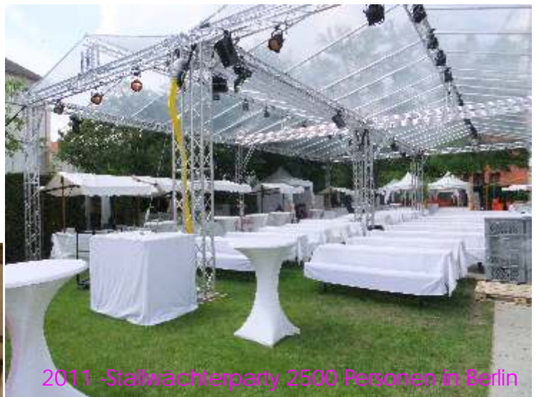
2011 -Stallwächterparty 2500 Personen in Berlin